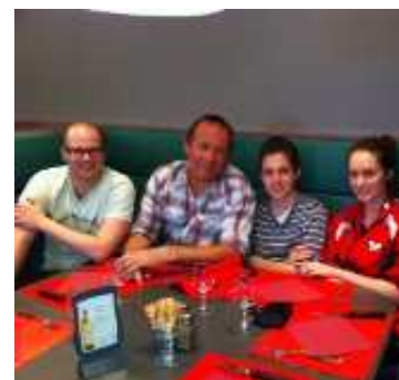
Une partie de l'équipe de R4 de l'année dernière